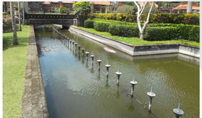
❖ ERiC Sidoarjo