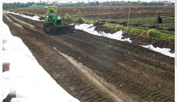
❖ Jalan Simpang Batang- Simpang Batam